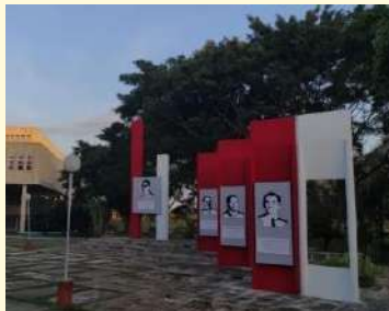
Plaza “Mártires de Humbolt-7”