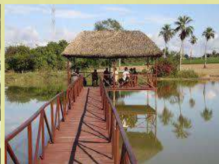
Parador de carretera “Las Barrigonas”