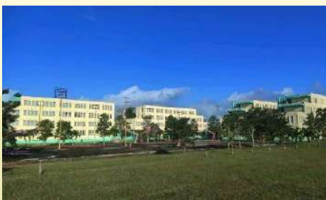
Universidad Agraria de La Habana

08:50 am. Recibimiento en la Universidad Agraria de La Habana “Fructuoso Rodríguez Pérez” – UNAH. Lugar: Plaza de los Mártires de Humbolt-7.