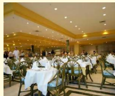
Hotel Habana Libre

2:45 pm. Salida hacia la Provincia de Artemisa. Recorrido guiado por Agencia ECOTUR.