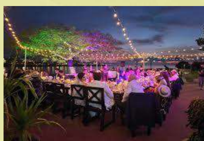
Restaurante “La Divina Pastora”