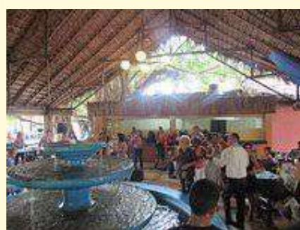
Centro Recreativo “La Cecilia”