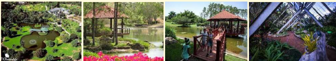
Jardín Botánico Nacional

09:30. Inauguración oficial del X Encuentro Iberoamericano de Turismo Rural. Lugar: Jardín Botánico Nacional – La Habana