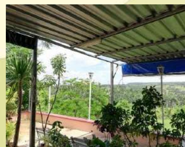
Finca Don David