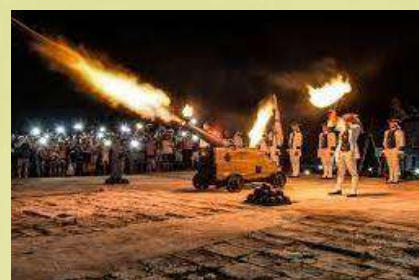
Cañonazo de La Habana