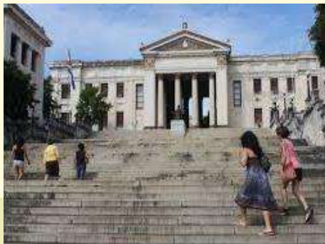
Universidad de La Habana

09:00-10:30 am. Agenda Académica / Panel 3: Contribuciones del turismo rural y el agroturismo para la mitigación y la adaptación al cambio climático: casos de éxito en Iberoamérica.