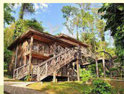
Hotel Rancho San Vicente

5:30 pm. Proceso de hospedaje en Hotel Rancho San Vicente. 8:00 pm. Cena y actividad cultural pinareña en el hotel.