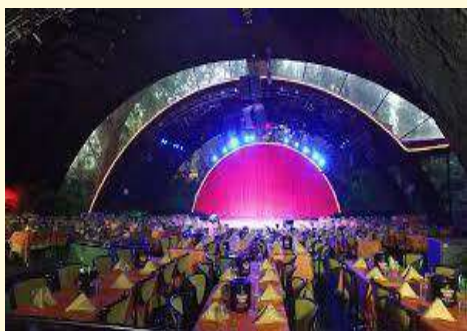
Salón Arcos de Cristal, Cabaret Tropicana

6:00 pm. Salida hacia Tropicana, “Un paraíso bajo las estrellas”– Municipio Playa. Recorrido guiado por Agencia ECOTUR.