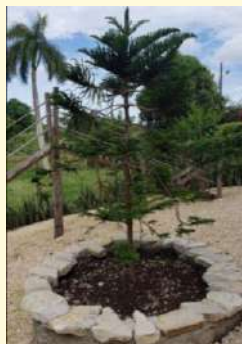
Finca Vista Hermosa