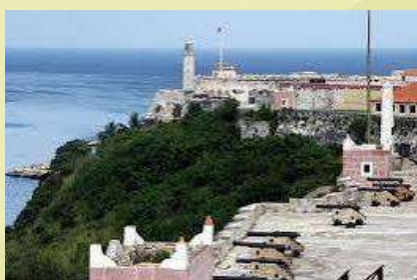
Complejo Histórico Morro-Cabaña

6:30-8:30 pm. Cena cubana en el Restaurante “La Divina Pastora” y paseo por el Complejo Histórico Morro-Cabaña