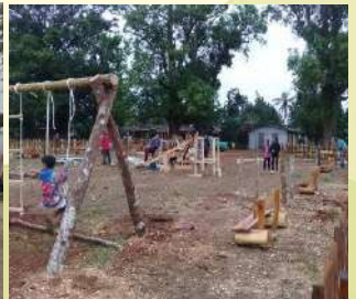
Granja Universitaria "El Guayabal". Ruta agroturística "Por los saberes agrarios"

5:30-6:00 pm. Encuentro con emprendedores rurales. Lugar: Comunidad "El Guayabal".