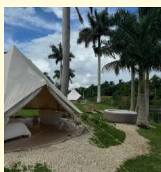
Hacienda El Patrón