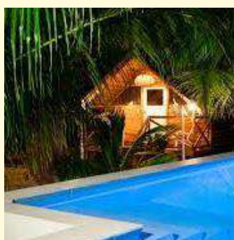
Hacienda El Bacura