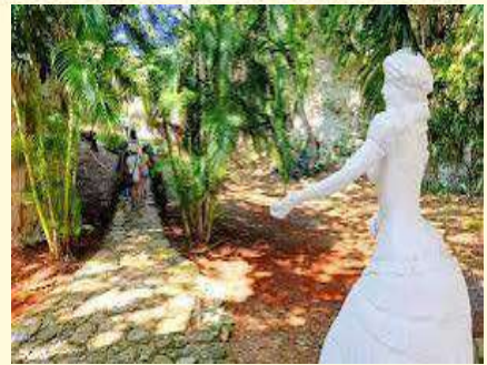
Paisaje Natural Protegido Escaleras de Jaruco.

3:00 pm. Salida hacia el Municipio San José de las Lajas.