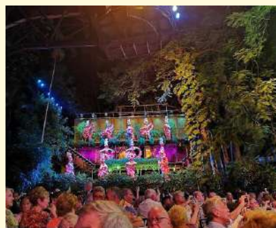
Cena Animación Tropicana