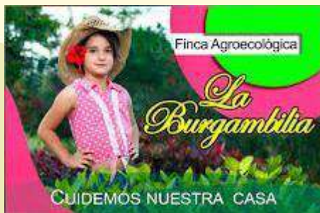
Finca La Burgambilia